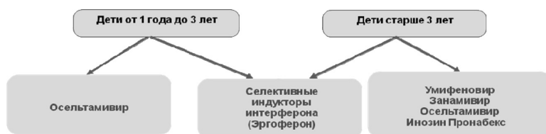
Рис. 2. Схема выбора противовирусной терапии у детей

Дозы и режим применения противовирусных препаратов представлены в приложении 8.