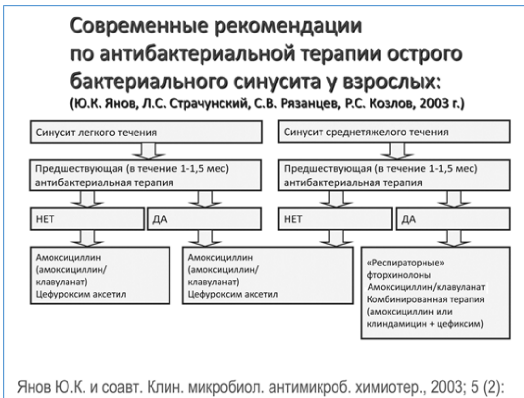
Рисунок 2 - Современные рекомендации по антибактериальной терапии острого бактериального синусита у взрослых [18].

При тяжелом течении острого риносинусита предпочтителен внутримышечный и внутривенный путь введения, целесообразно назначение цефалоспоринов: цефотаксима** или цефтриаксона**. При внутривенном введении используются амоксициллин+клавулановая кислота ** и цефалоспорины. В случае риска анаэробной инфекции – возможно назначение клиндамицина** в комбинации с цефалоспорином (рис. 2).